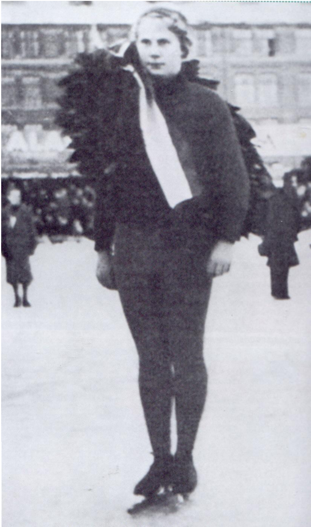
Vår store dronning Laila Schou Nilsen, verdensmester i Davos i 1937.