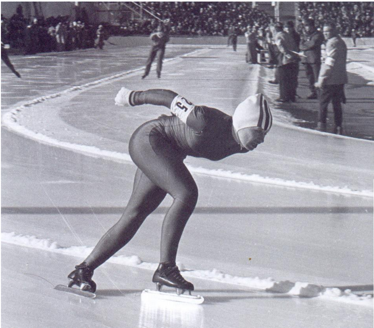
Lisbeth Korsmo på vei mot OL- bronse på 3000 meter i Innsbruck 1976.

Sigrd Sundby Dybedahl står som en av våre beste kvinnelige skøyteløpere gjennom tidene. Hun viste styrke på alle distanser. Dessverre ble hun tidlig syk og døde i 1977. Personlige rekorder: 500 meter: 43.8, 1000 meter: 1.30.14, 1500 meter: 2.19.00, 3000 meter: 4.58.4.