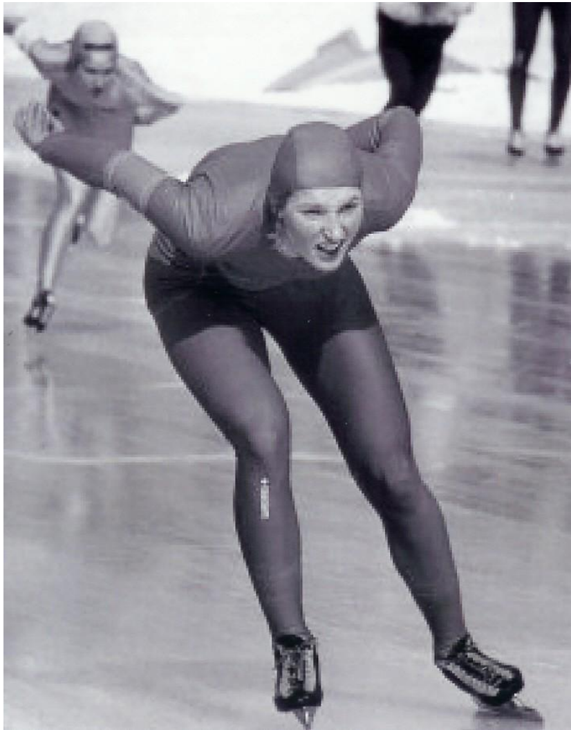
Bjørg Eva Jensen på vei mot olympisk gull i 1980. Bak skimtes Beth Heiden.

I 1978 gjør hun den bragd å sette fem juniorverdensrekorder på Medeoanen i Alma Ata!